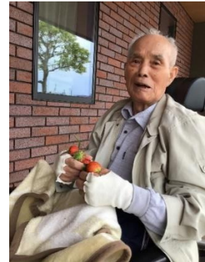
おいしいいちごができました！