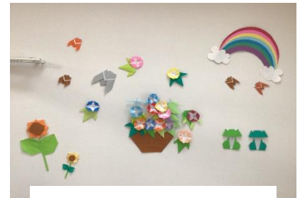
7月 あさがおとせみ