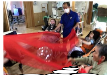
ボールを落とさないように