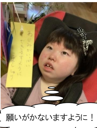
願いがかないますように！