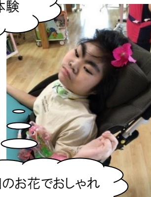
こすもす畑のお花でおしゃれ