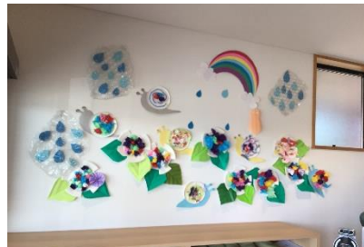
6月 あじさいとかたつむり